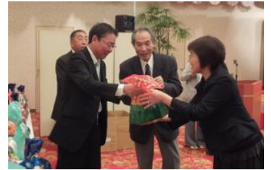
市川会員ご夫妻金婚式の御祝