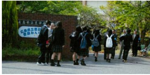
5月15日(水)豊田高校でのあいさつ運動