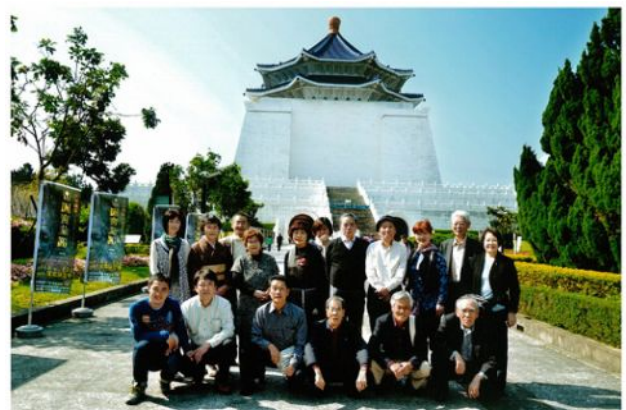
竹原ロータリークラブ 御一行様 中正記念堂 2013.02.28