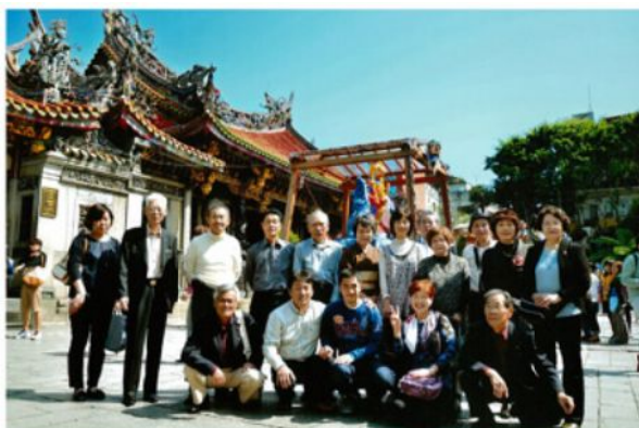
竹原ロータリークラブ 御一行様 龍山寺 2013.02.28