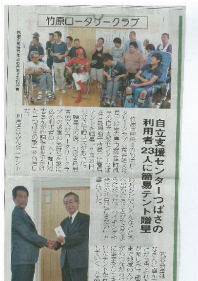
プレスネットに目録贈呈式の記事が掲載されました